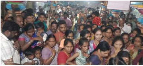
కబురు న్యూస్,బోధన్ సవంబర్ 15..

బోధన్ పట్టణంలోని శ్రీ చక్రేశ్వర శివ మందిరంలో లక్ష దీపారాధన మహోత్సవ కార్యక్రమం భక్తి శ్రద్ధలతో నిర్వహించారు. శుక్రవారం కార్తీక పౌర్ణమి పురస్కరించుకొని వేకువ జాము నుండి పెద్ద ఎత్తున