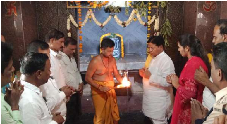
కబురు న్యూస్,బోధన్ సవంబర్ 15..

బోధన్ పట్టణంలోని శ్రీ చక్రేశ్వర శివాలయంలో మాజీ మంత్రి, ఎమ్మెల్యే సుదర్శన్ రెడ్డి ప్రత్యేక పూజలు